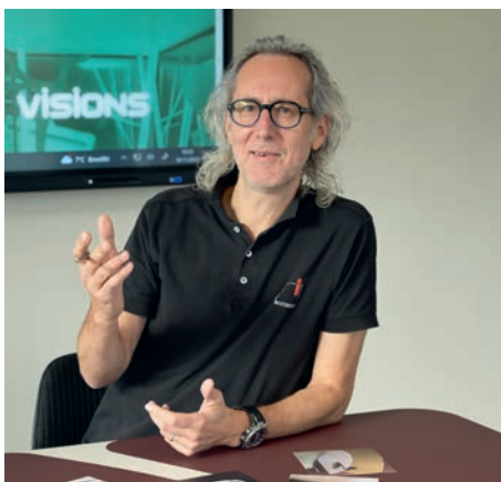
Patrick Indra Indra + Scherrer AG Architektur

So ziemlich. Dem Bauherr war vor allem wichtig, dass es ein funktionelles Gebäude werden soll. Er ist technisch sehr versiert und liebt die erkennbare puristische Funktion. In Bezug aufs Aussehen und den Stil hat uns der Bauherr freie Hand gelassen und so konnten wir kreativ werden. Er sagte in Ruhe: «Das machen ihr scho».